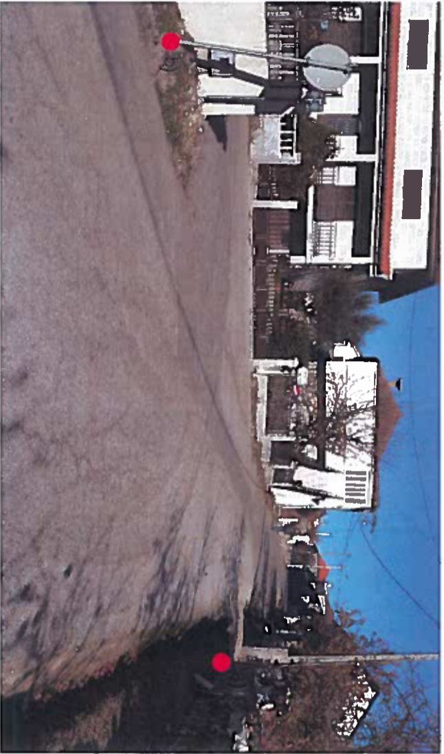
Fotografia do local.