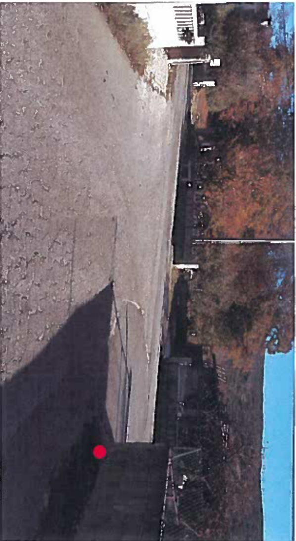
Fotografia do local.