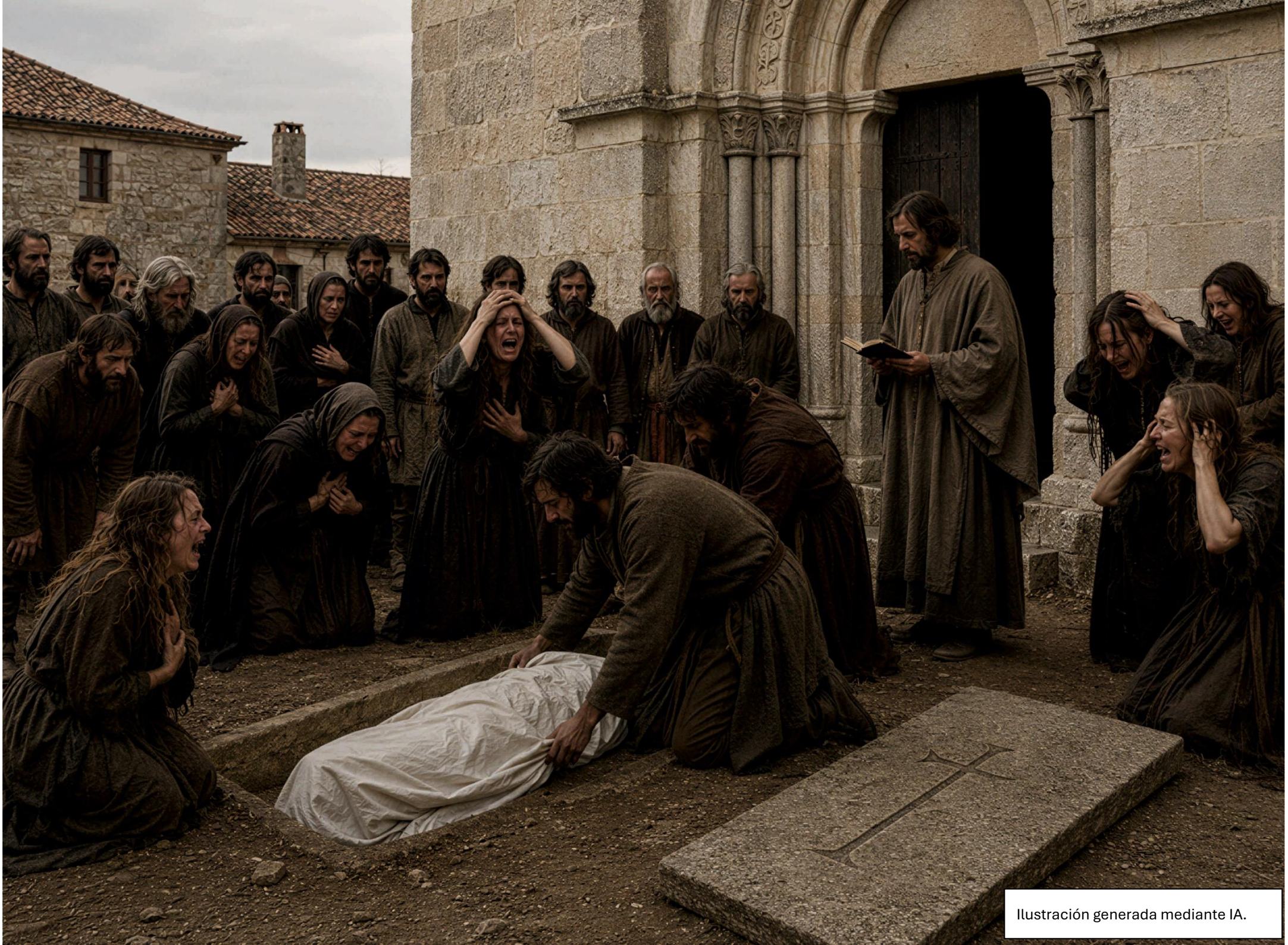
Ilustración generada mediante IA.