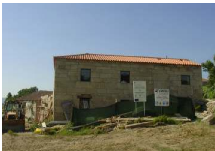
Remodelação Urbanística e Tecnológica da Área Termal - Jardim do Tabolado - 1ª Fase