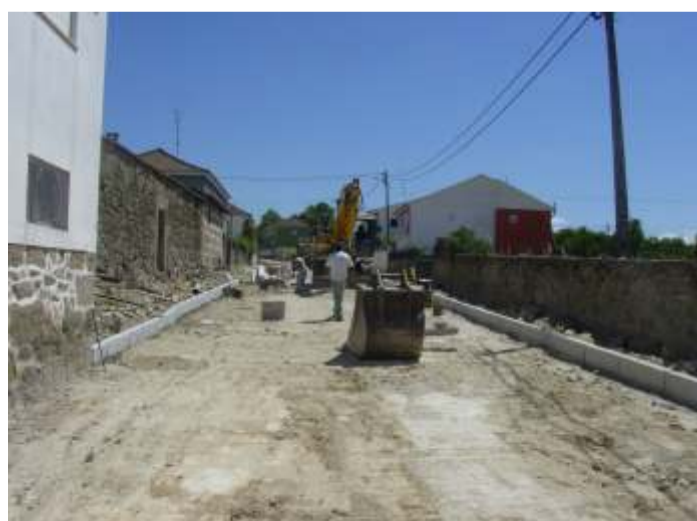
Remodelação da Rua Central em Outeiro Seco