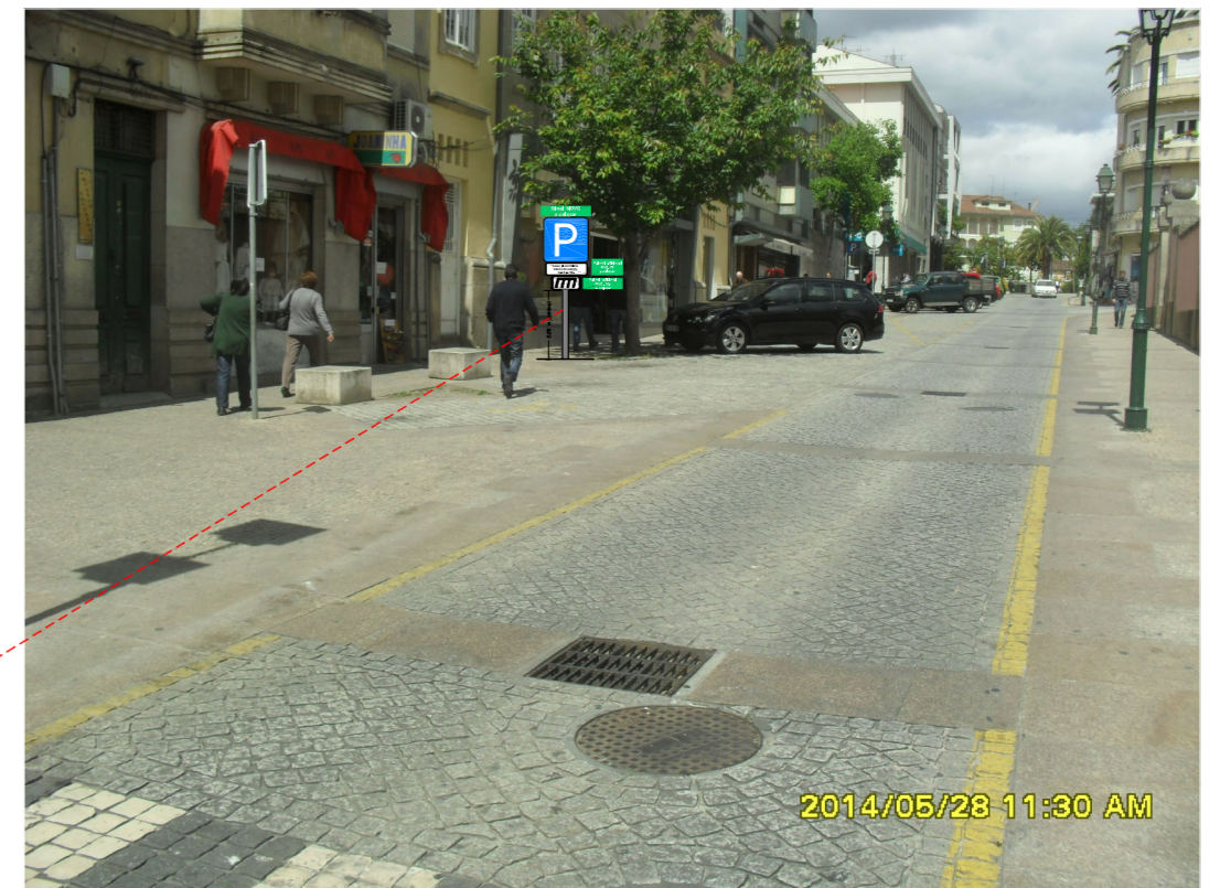
Fotografia do local