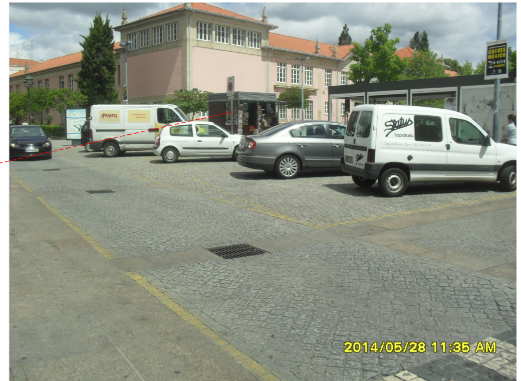
Fotografia do local