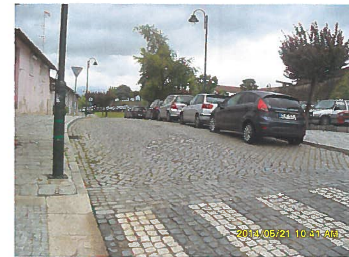
Largo da Pedisqueira