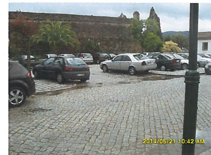
Acesso ao parque de estacionamento