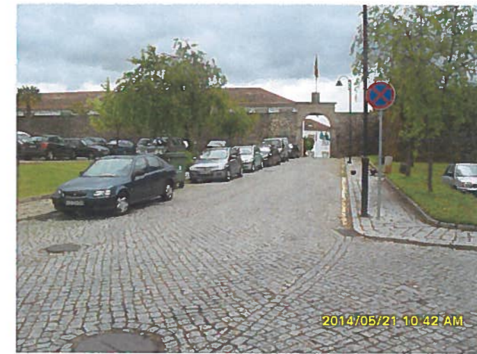
Rua Terreiro da Cavalaria